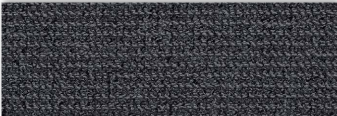
74 4m + 5m