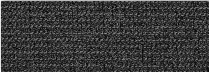
79 4m + 5m