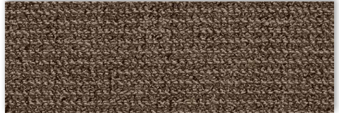
34 4m + 5m