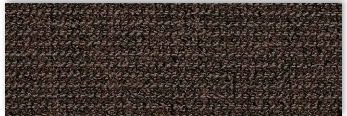
44 4m + 5m