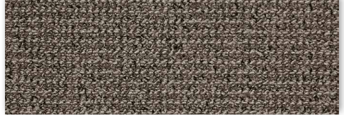
39 4m + 5m