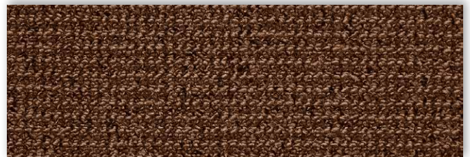
84 4m + 5m

La société Associated Weavers se réserve le droit de modifier les caractéristiques de ce produit tout en conservant les mêmes qualités techniques. Il est fortement conseillé d'utiliser les coloris moyens et foncés pour les pièces à grand trafic.