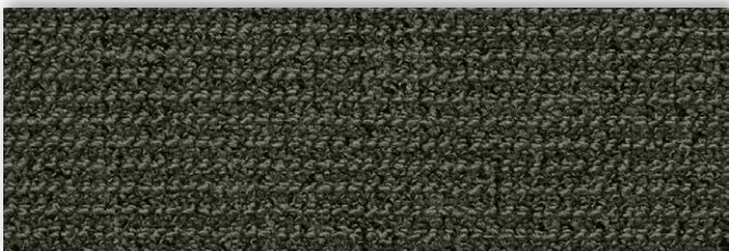
29 4m + 5m