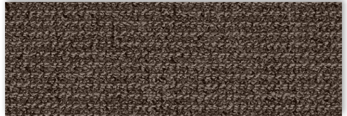
49 4m + 5m